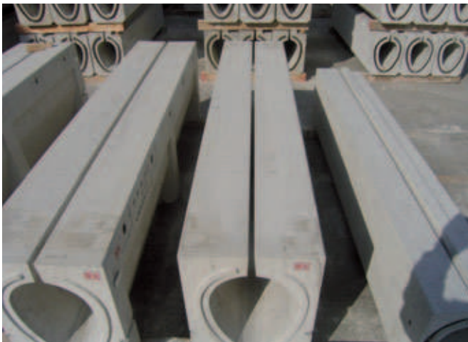
Abb. 1: Eiförmige Straßendrainageprodukte

Verwendung von Schalungen. Ermöglicht hat diesen Durchbruch Toyota Kohki mit seinem innovativen „One-Touch“-Innenkern für ein schnelles Entschalen (siehe Abb. 5), was die Verbreitung der Drainagen mit eiförmiger Form in ganz Japan nach sich zog. Die Form des Betonproduktes wurde entsprechend den Marktanforderungen immer komplexer, somit gewinnt auch die Schalungstechnologie zunehmend an Bedeutung. Darüber hinaus wird von der Betonfertigteildruckindustrie nicht nur die Herstellung von Produkten, sondern auch eine kontinuierliche Verbesserung der Produktivität und Qualität erwartet. Die Rolle der Schalungsproduzenten ist daher entschei-