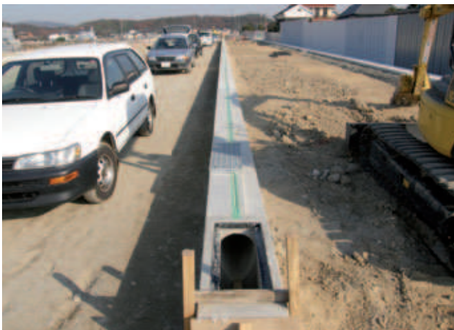
Abb. 3: Verlegung der Drainageelemente