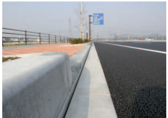
Abb. 4: Fertigstellung der Bauarbeiten