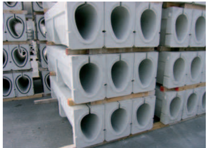
Abb. 2: Produkte im Lager